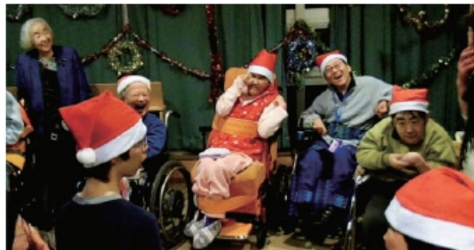
ホームのクリスマス会