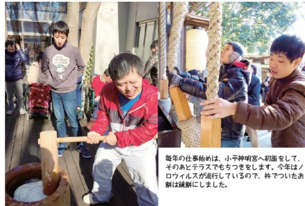
毎年の仕事始めは、小平神明宮へ初詣をして、 そのあとテラスでもちつきをします。今年はノ ロウィルスが流行しているの、杵でついたお 餅は鏡餅にしました。