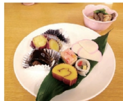
【写真】新年会の様子

私は天気予報や気象に関するこ とに興味があり、日々の天気予報 を支援センターあさやけの廊下に 掲示しています。今年はその掲示 を更に充実させて、当たる天気予 報を目指すつもりです。他にも、