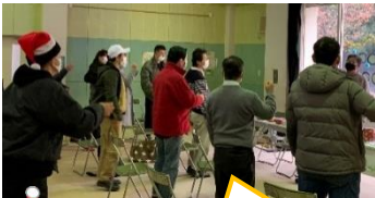
じゃんけんクリブル 抽選会！