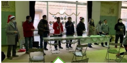
大盛況の トーンチャイム♪