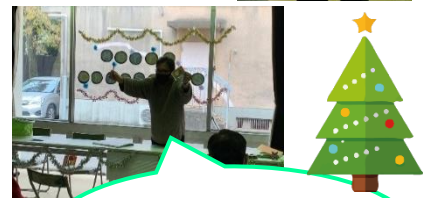
小林スタッフの マジックショー☆彡