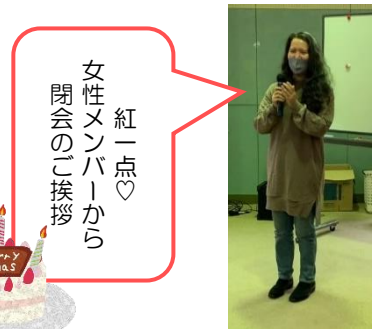
女性 紅一点 メンバーから 閉会のご挨拶