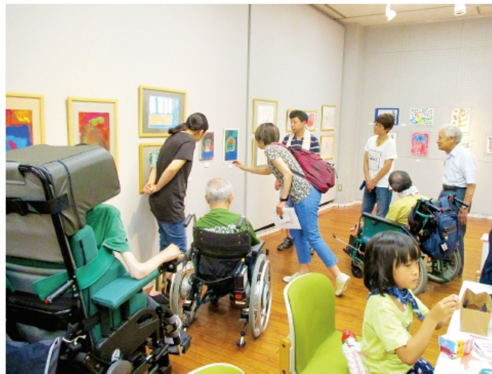
回を重ねてアートフェスティバルも地域に定着してきました。今年も会場にたくさんの方が作品が展示され、来場された人を楽しませてくれました。