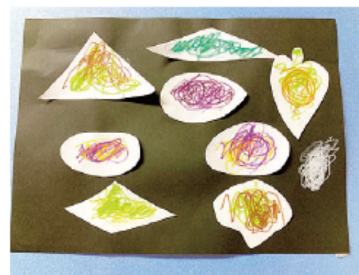
いろいろな形に切り取った白い画用紙にたくさん模様を描いて、貼って…素敵な絵が完成しました！