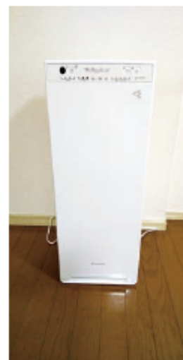
空域洗浄・加湿器

面談…時間を決めて行っていますが、「もっと話したい」という人もいます。また、こういう時だからこそ話を聞く時間を増やしています。長時間話したい人には内線（各居室につながっている）を使うことにしました。長電話的な感じも楽しいものですね。