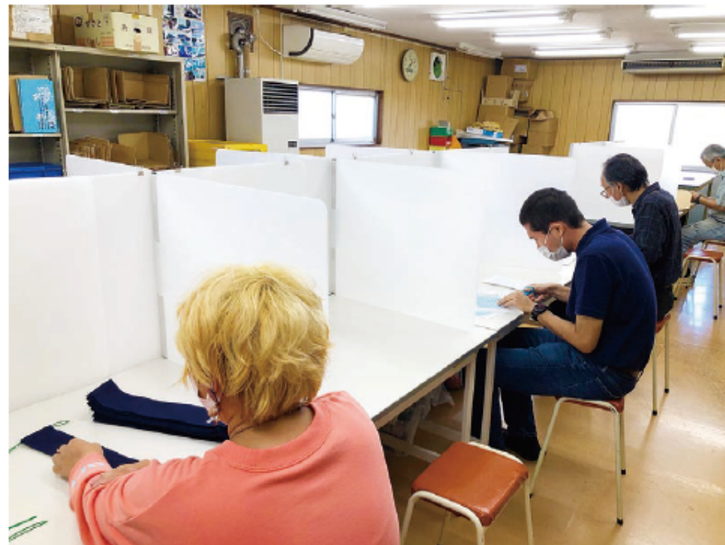
感染対策をして働く