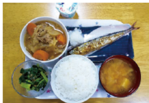
ある日の夕食 焼きさんま 大根おろし 肉じゃが おひたし ごはん 味噌汁 ヨーグルト

食事…4月から平日の夕食は自室で食べてもらい、土日の昼食は、2グループに分かれてホールで食べています。食事前の検温も慣れました。食事中ついうっかり話しをしてしまう人もいますが…おしゃべりができない分、美味しい料理を提供しています。