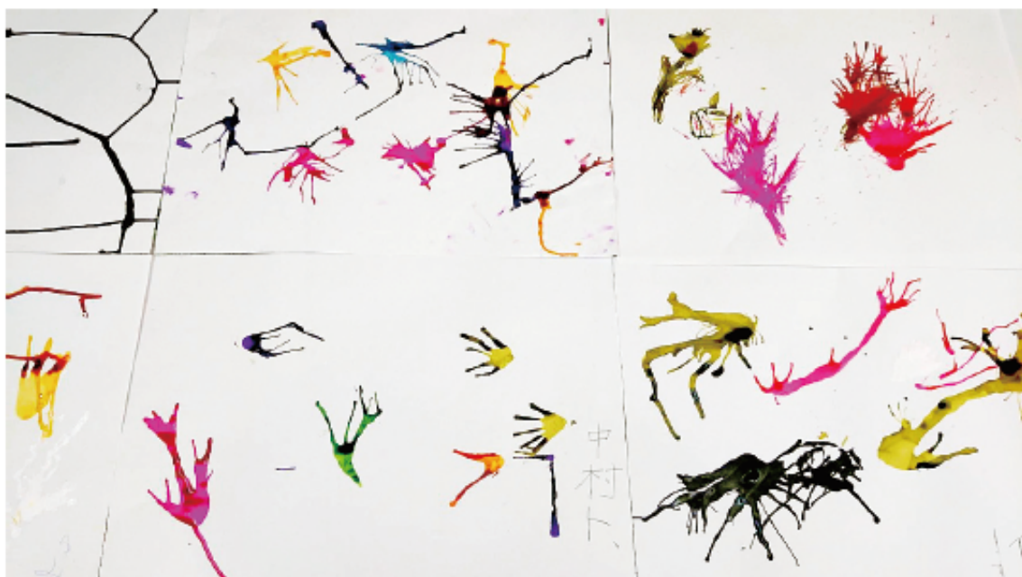
いろいろなインクを垂らしてこの日もみんな思いのままに作品を作られていました。