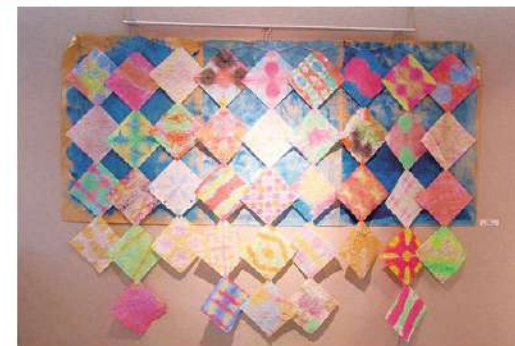
あさやけ風の作業所